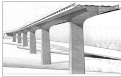
Aurachtalbrücke (Entwurf SSF-Ingenieure AG)

In unmittelbarer Nachbarschaft befindet sich noch ein weiteres interessantes Museum: