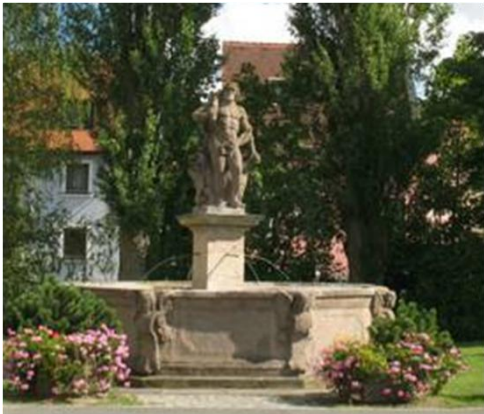
Herkulesbrunnen seit 1801 im Ortskern

Dem Hauptverein mit heute ca. 300 Mitgliedern hat sich 1978 der Musikzug Emskirchen als eigenständige Abteilung angeschlossen. Die Übungsräume befinden sich im Vereinshaus.