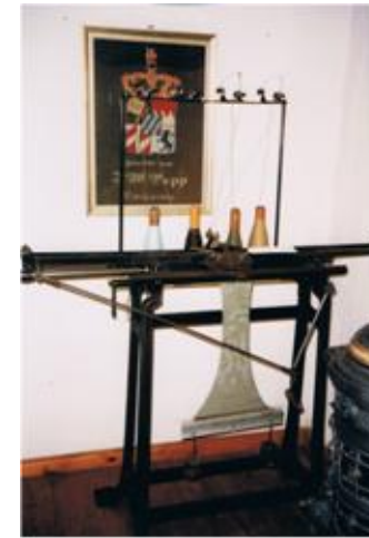
1. bayerische Strickmaschine

Die Vielzahl der gezeigten Exponate stammt aus der Zeit von 1880 bis 1950 und sind Schenkungen oder Leihgaben aus Emskirchen und der Region.