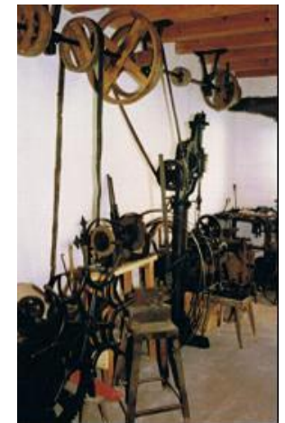
Transmission in der Schmiede

Im Bereich Handel und Gewerbe erinnert z.B. die älteste Strickmaschine Bayerns an eines der wichtigsten Gewerbe um 1900 in dieser Gegend.