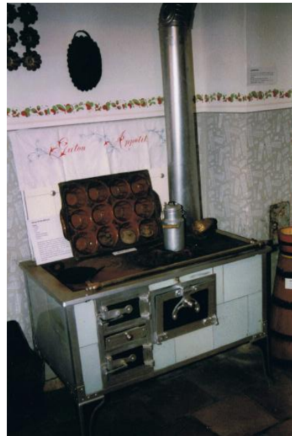
Küchenherd aus dem Brandenburger Haus

Diese drei Bereiche prägen heute auch das Museumskonzept. So vermitteln Küche, Kammer und Stube einen Eindruck des bäuerlichen Lebens um die Jahrhundertwende.